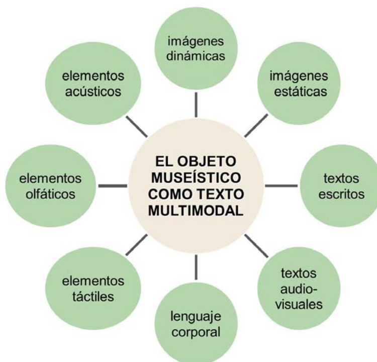
Fig. 1: El objeto museístico como texto multimodal.

En el museo, por tanto, el objeto museístico forma parte del texto multimodal (fig. 1):