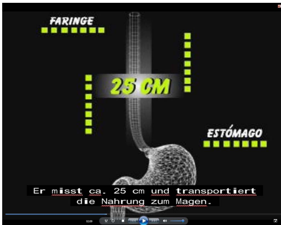
Fig. 4: Imagen sacada del vídeo El Aparato Digestivo , con subtítulos para sordos, en alemán.